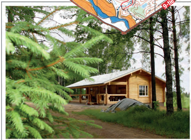
Metsämaan metsästyseuran uusi komea metsästysmaja.